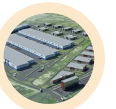
Современная промышленная инфраструктура