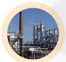
Топливо- энергетический комплекс