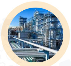
Нефтегазовое Машиностроение и металлургия